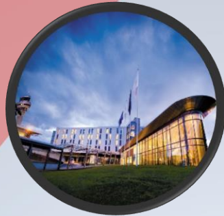
Radisson Blu Hotel Trondheim Airport