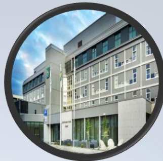
Quality Airport Hotel Værnes