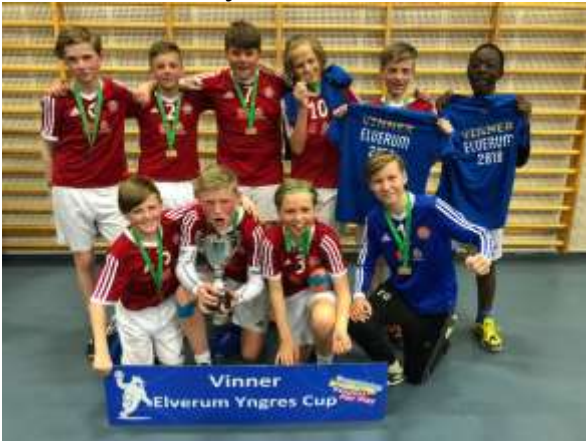
Vinner G12 – Tynset IL