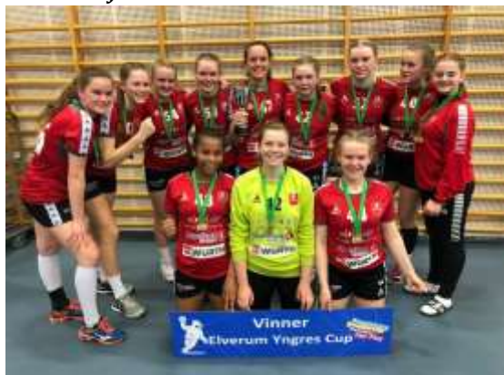
Vinner J14 – Nit Hak