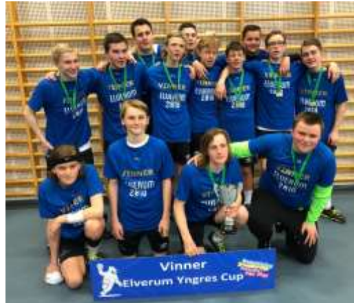
Vinner G14 – Elverum