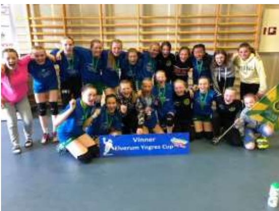
Vinner J12 – Ull Kisa