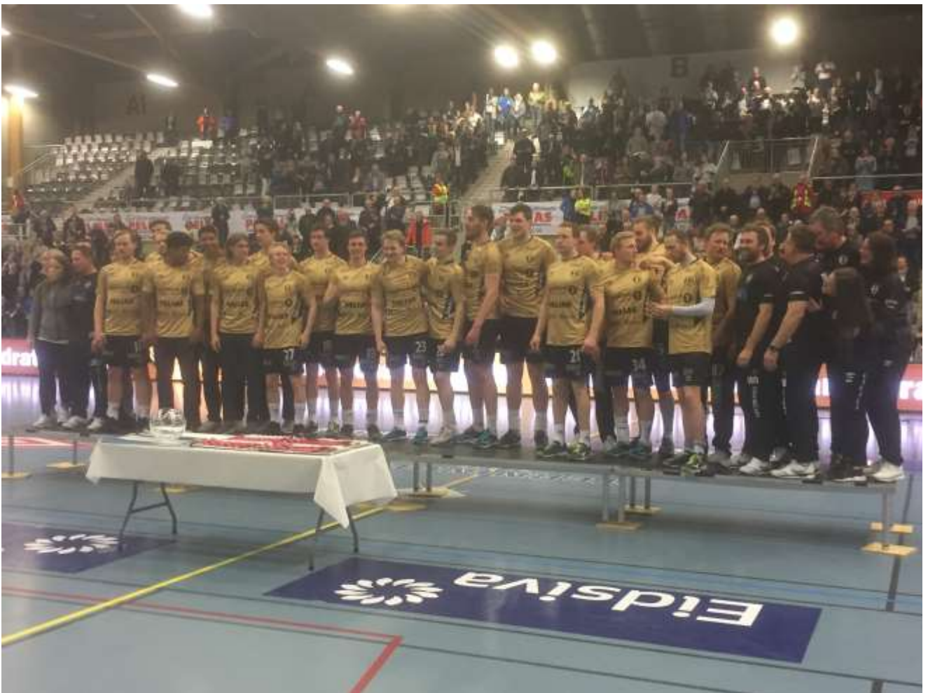
Seriegullet til Elverum 2017/2018