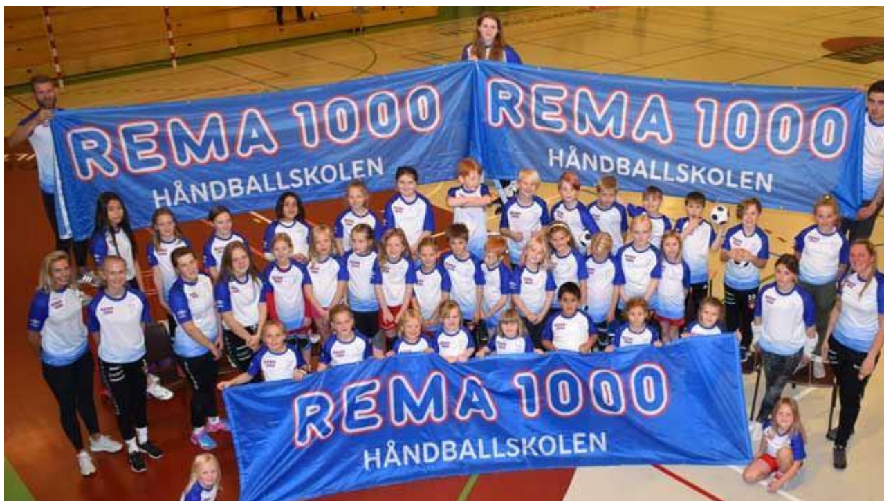
REMA 1000 Håndballskole