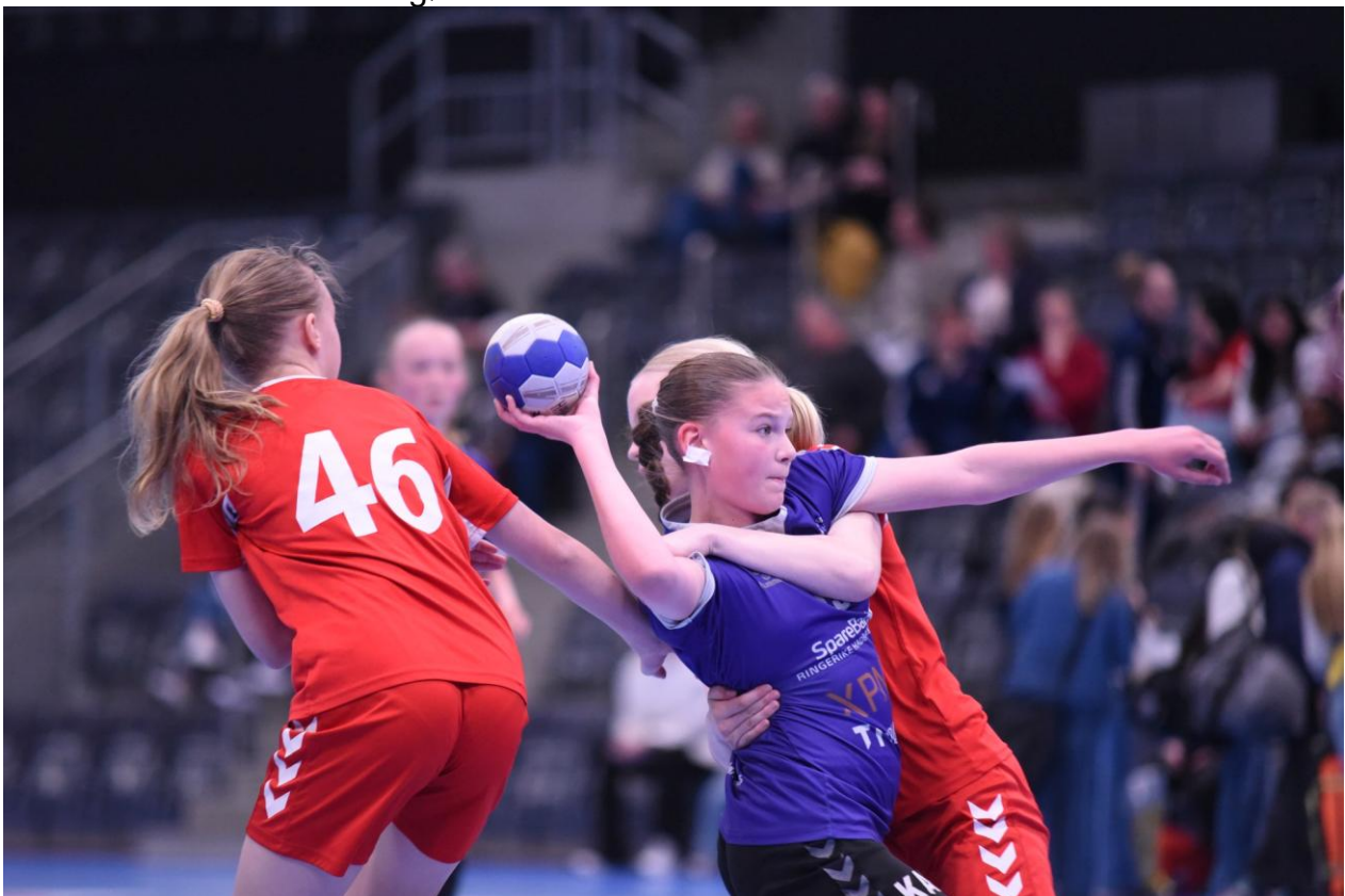
Elverum Yngres Cup 2024.

19.-21. april 2024 satte Elverum Yngres Cup ny deltakerrekord med 225 deltakende lag. For første gang var også 6, 7 og 8-åringene med – de spilte miniturnering med tre kamper på en dag. Totalt deltok 40 minilag. Elverum, Hernes, Jømna/Heradsbygda og Vang Håndball var tekniske arrangører.