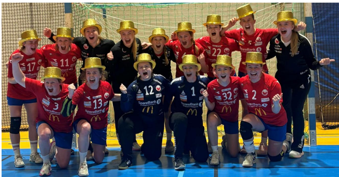
Foto: Hentet fra nettsiden til Otta/Vågå. Gratulerer med opprykker opp til 2.divisjon