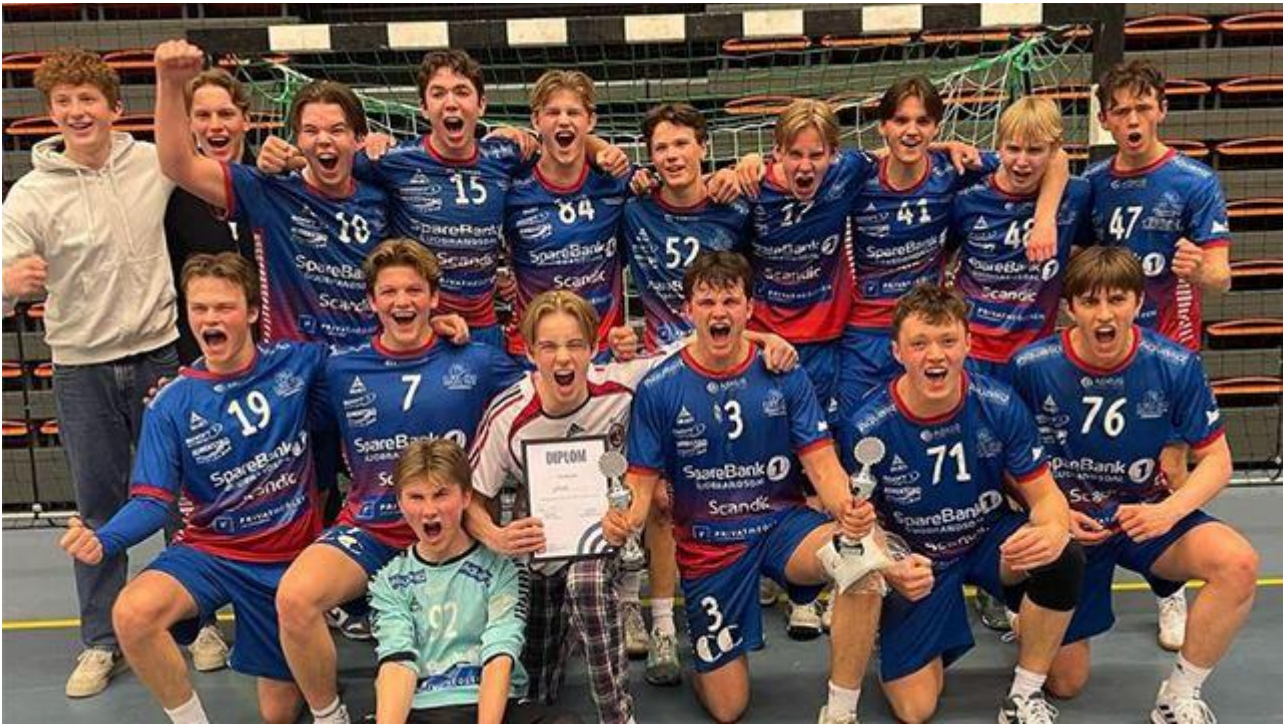
LFH09 G16 var blant vinnerne av Sluttspillet 2023/24.