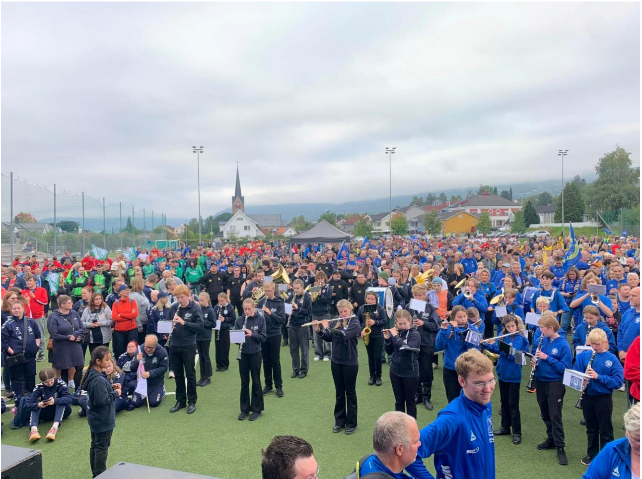
Åpningsseremoni på Sportsplassen i Lillehammer under Landsturneringen 2023.

7.oktober tok Elverum imot Kolstad til storkamp i Håkons Hall . Trønderne vant 32-27 foran omtrent 6700 tilskuere.