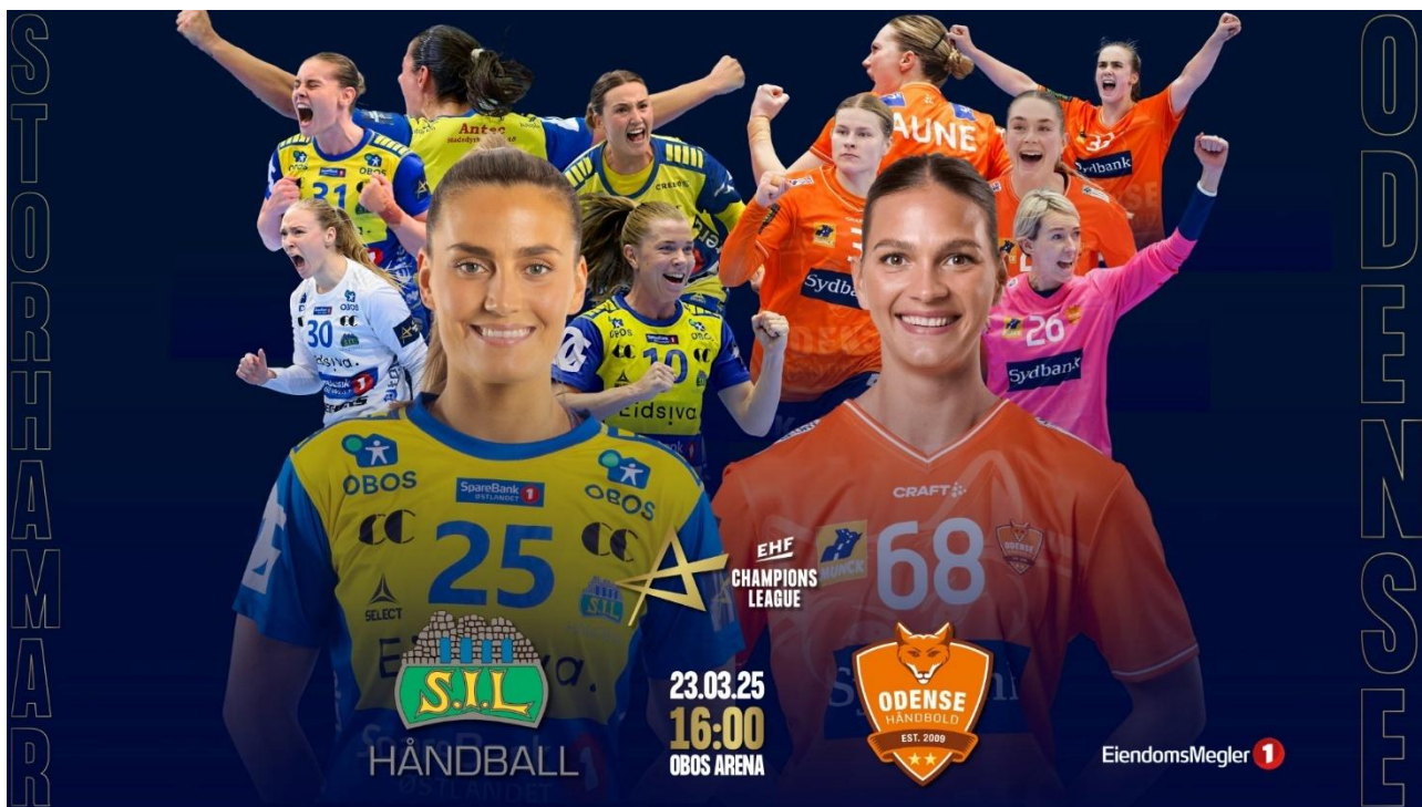
Storhamar Elite i Champions League sesong 2024-2025