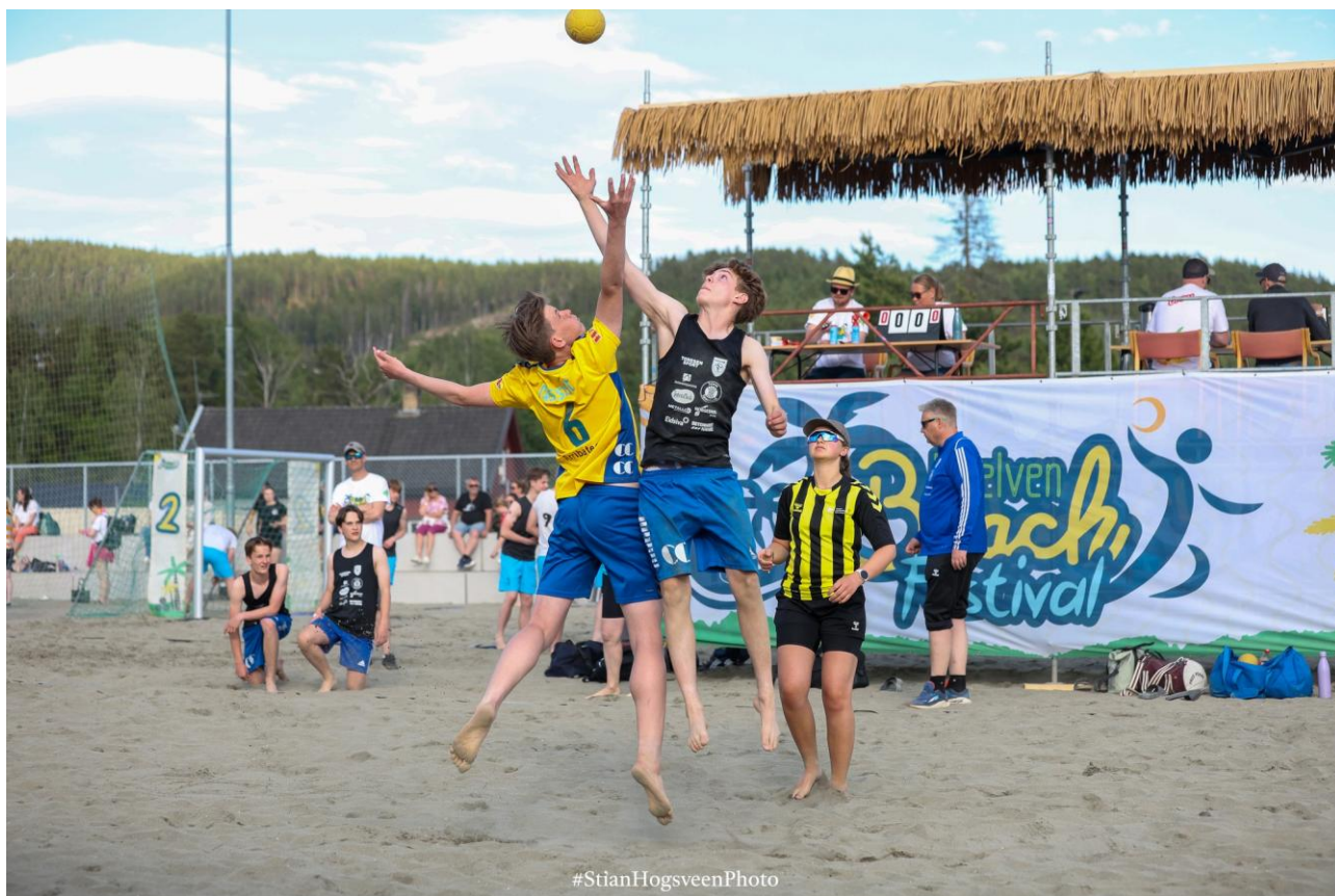
Regionmesterskapet i beachhåndball 2025.

Regionmesterskapet i beachhåndball ble igjen arrangert i Moelv i samarbeid med Moelven IL. Det var strålende vær hele helga. 59 lag deltok på Regionmesterskapet og 55 lag deltok på Mini Beachhåndball 6-12 år - totalt 114 deltakende lag.