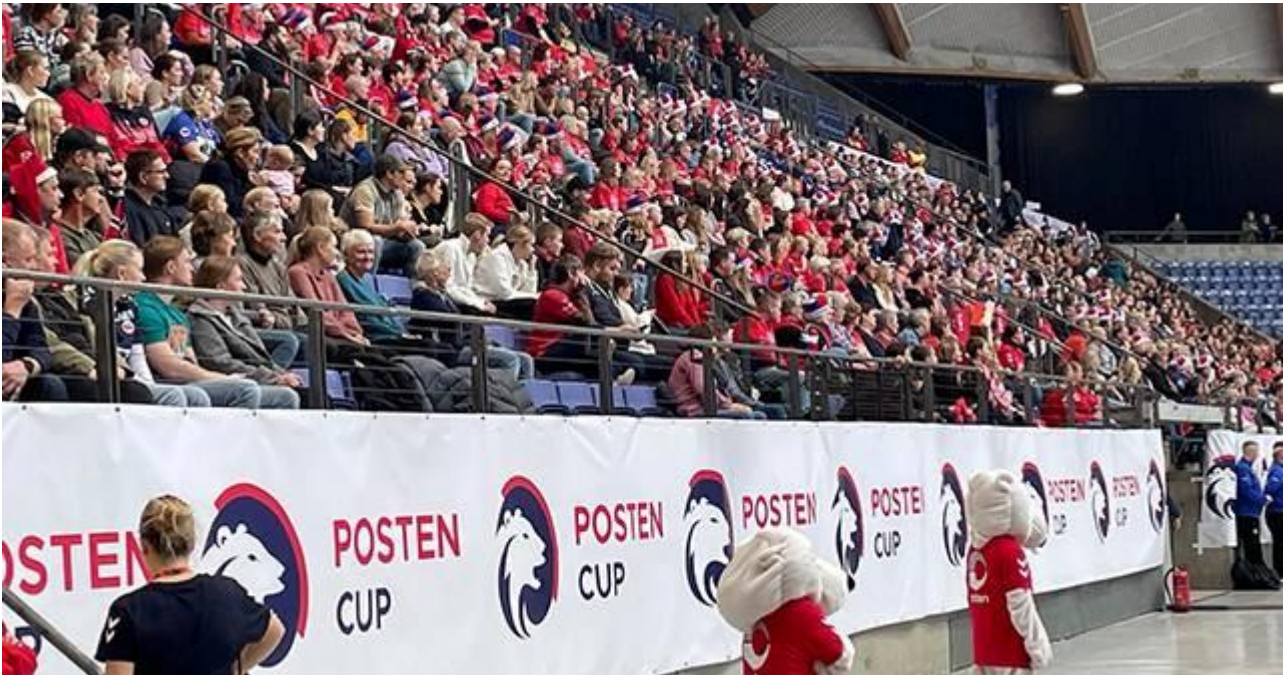
Posten Cup i Håkons Hall 25. november 2023.