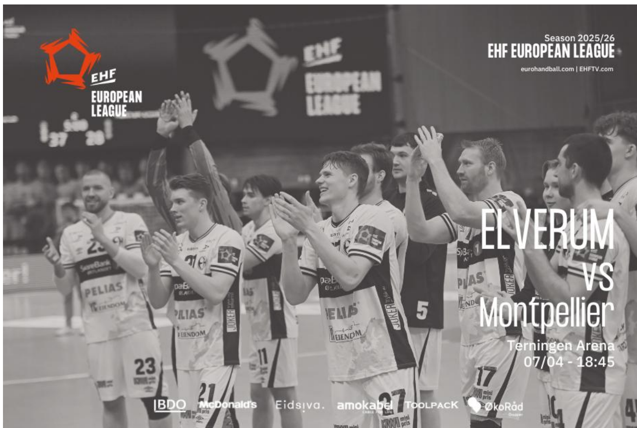
Elverum i EHF European League